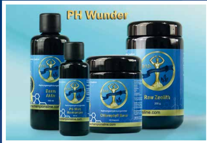
PH-Wunder: Darm Aktiv, PH-Wert Harmonizer, Raw Zeolith, Chlorophyll Base

Mit den IBMS® ChampionsLine® Paketen “PH Wunder” und “Fundament des Lebens” haben Sie die Möglichkeit Ihren Körper aufzubauen. Beide Pakete beinhalten “Darm Aktiv” . Dieses enthält unter anderem das wertvolle EDS-Extrakt mit Milchsäurebakterien. EM Mikroflora kann dem Körper dabei helfen, die Verdauung zu regulieren. Wichtige Lactobakterien unterstützen ein ausgewogenes Bakterienmilieu im Darm. Das Basenprodukt “Chlorophyll Base” liefert optimale Mineralien und Chlorophyll um ein basisches Milieu zu fördern, sowie PH-Tropfen um selbst basisches Wasser herzustellen. Alle diese Produkte können auch sehr gut als Begleitung zum Fasten, Darmspülung und Darmaufbau generell eingesetzt werden. Das ChampionsLine® OPC POWER of health sowie ChampionsLine® CBD Power of Life , und auch der IBMS® Cham-