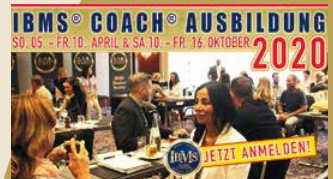
IBMS® CERTIFIED COACH (AUSBILDUNG)

“ES GIBT EIN LEBEN VOR COLDWELL UND EIN ANDERES, BESSERES NACH COLDWELL.”