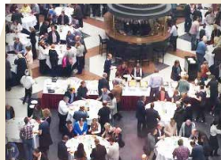
IBMS® MASTERS SOCIETY™ TREFFEN

“WER NICHT HIERHER ZUM SEMINAR KOMMT, DER VERPASST SEIN LEBEN.”