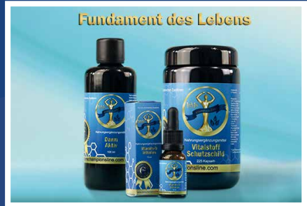
Fundament des Lebens: Darm Aktiv, Vitalstoff Schutzschild, Vitamin-D Infusion

pionsLine® Vitalstoff Schutzschild sowie alle anderen Produkte können einzeln eingenommen oder kombiniert werden.